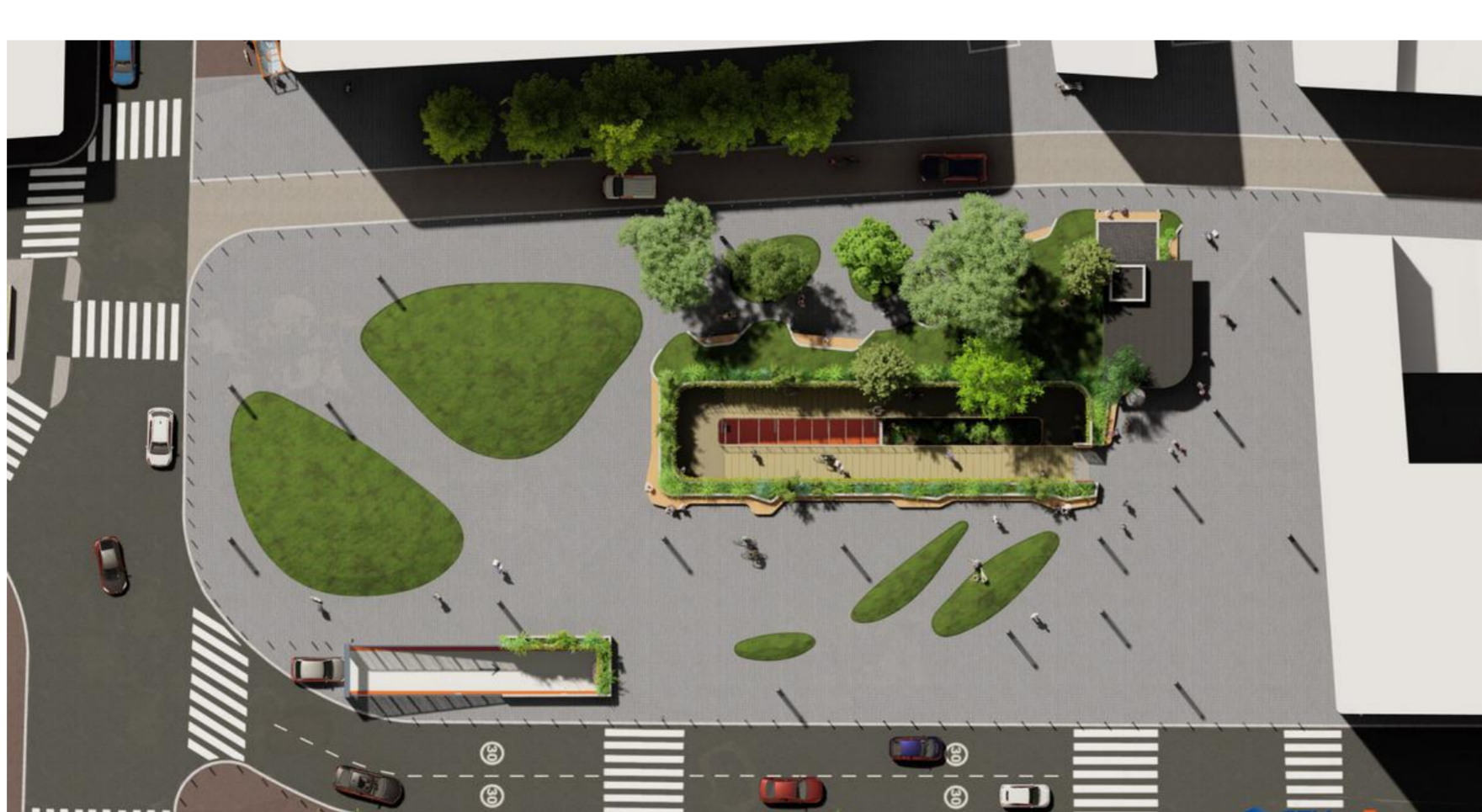
Le Parc Gambetta/Square des commandos du Climat va être ouvert et percé pour construire une trémie d'accès dédiée aux mobilités douces, et végétalisée. GTM/Félix associés ateliers de design