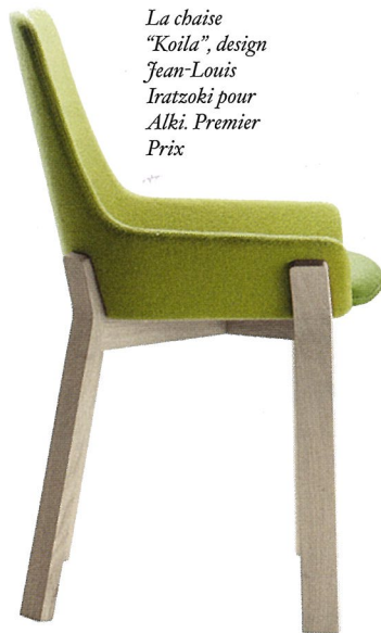
La chaise "Koila", design Jean-Louis Iratzoki pour Alki. Premier Prix