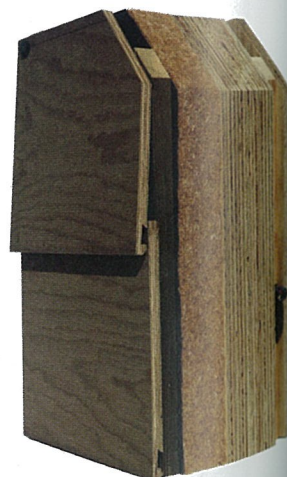
Composant constructif en contreplaqué de pin maritime, design Christian Colvis pour Rolpin. Prix "Le pin maritime"